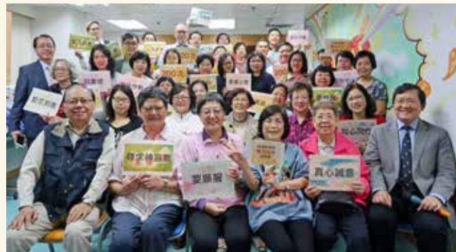
第 200 次晨曦祈禱會