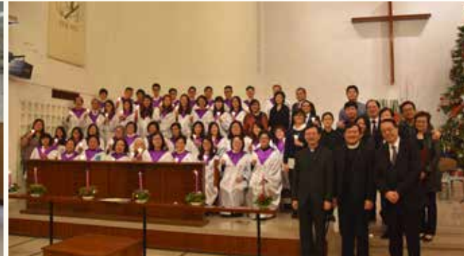
2016 平安夜聖樂燭光崇拜