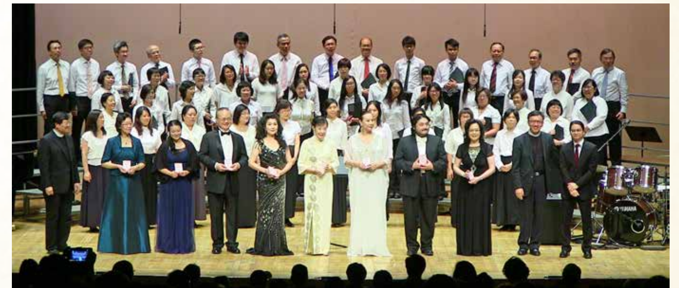
北角衛理堂重建籌款暨北角衛理兒童合唱團三十三周年音樂會