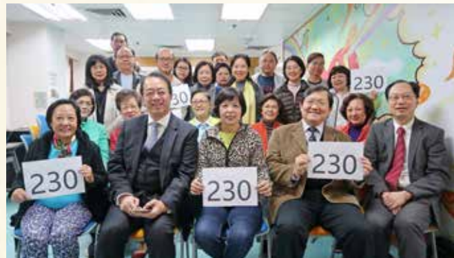
第 230 次晨曦祈禱會