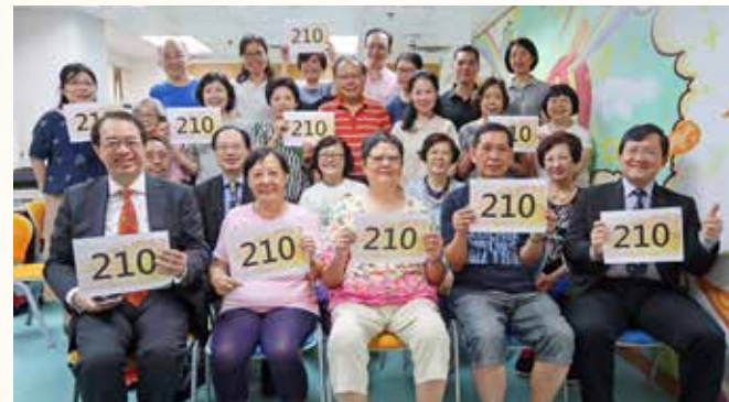
第 210 次晨曦祈禱會