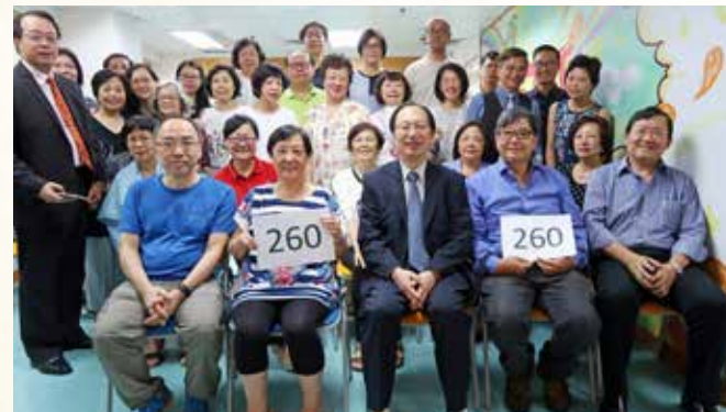
第 260 次晨曦祈禱會